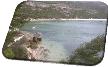
Portinho D'Arrábida, Portugal, 2005