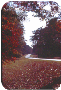
Natchez Trace, Mississippi, 11/2001